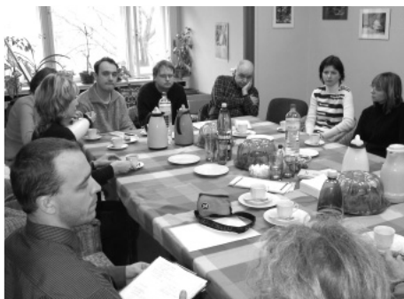
Setkání zástupců českých a německých chráněných dílen v rámci projektu Nové Impulsy, který je financován Nadací Roberta Bosche.