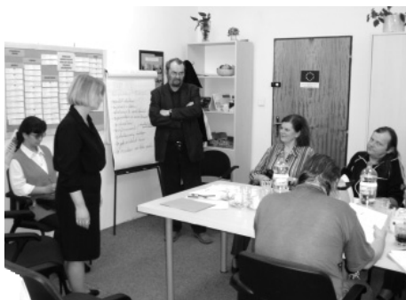
Ukončení 11. běhu Job klubu – kurzu přípravy na zaměstnání