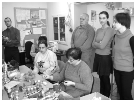
Setkání zástupců českých a německých chráněných dílen v rámci projektu Nové Impulsy, který je financován Nadací Roberta Bosche.