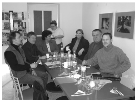
Pracovní setkání s německými partnery z LAG IF Sachsen v Drážďanech v prosinci 2004.